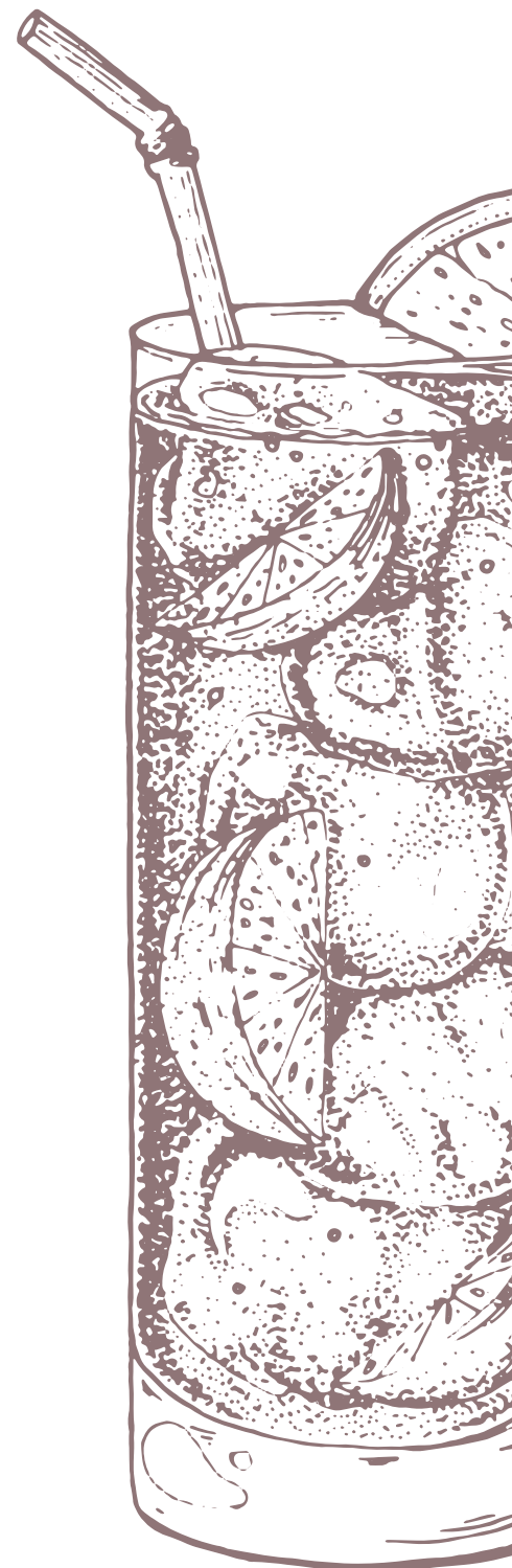
PLATE OU PÉTILLANTE